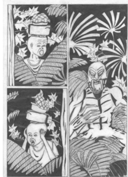
Zeichnung: Jeremias Fernando Uamba, Titel: As surpresas da mata